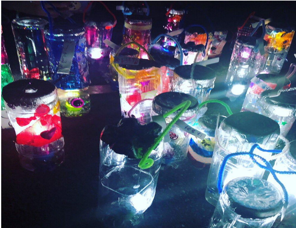
2018年 ペットボトルランタン